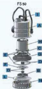
TABELLA MATERIALI / MATERIALS TABLE