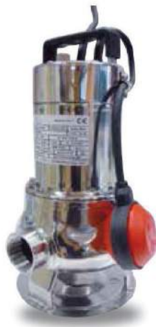
FS80 / 40 FS100 / 50 FS150 / 50 FS200 / 50