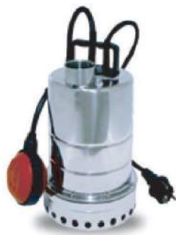
FS50 / 32